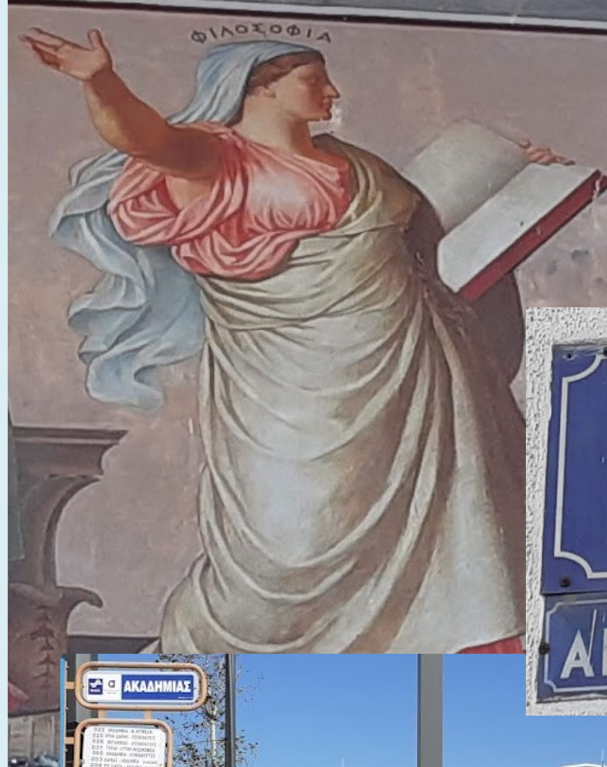
Athény, dnešní Národní a Kapodistrijská univerzita, kolem roku 1888. Eduard Lebiezki, podle návrhu Karla Rahla, Athénská univerzita - Propylaje