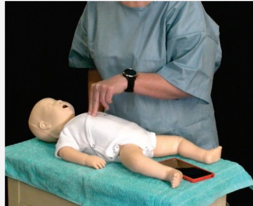
Video 5: Resuscitace dětí

U dětí od jednoho roku do puberty bývá náhlá zástava krevního oběhu druhotně vyvolaná dušením. Postup je proto odlišný změněným pořadím úkonů. Níže je postup resuscitace dítěte při samotném zachránci .