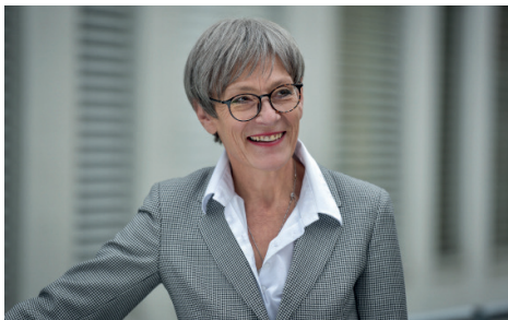
Přednostka Ústavu ošetrovatelství 3. LF UK

„Nároky dnešní zdravotnické praxe vyžadují sestru nejenom připravenou po stránce praktické, ale sestru, která vykonává činnosti a úkony, kterým rozumí, dokáže je vysvětlit, umí logicky odvozovat a na základě znalostí předvídat. Naše fakulta dává budoucím sestřám dobrou přípravu. Studenty si pečlivě vybíráme a řada našich absolventek a absolventů nachází uplatnění v intenzivní péči, ve výuce studentů i v zahraničí. A ti nejlepší mohou pokračovat v magisterském studiu a získat specializaci pro práci v intenzivní péči!“