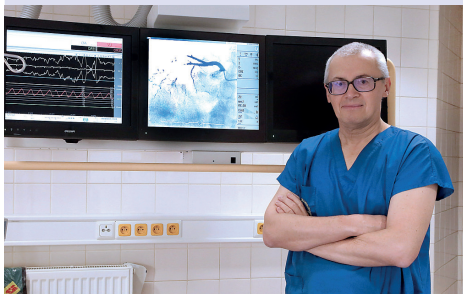
Děkan 3. LF UK