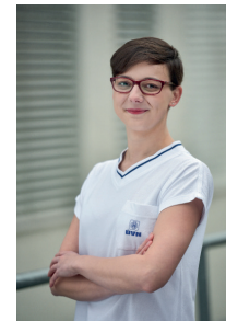
Absolventka oboru Všeobecná sestra

„Studium Ošetrovatelství na 3. LF UK bylo až fascinující. Na fakultě vládne rodinná atmosféra, vyučující se o studenty starají a dbají na to, aby se z nich stali dobré sestry. Pro mě, jako pro absolventku gymnázia, to byl malý zázrak, že jsem dostala šanci stát se sestřičkou. I když se mi některé předměty zdály skoro nespílitelné, nakonec jsem je zdolala. Přestože jsem si mockrát během studia zaplakala a probděla nespočetně nocí v knihovně, stejně jsem fakultu vždycky měla ráda, mám ráda a budu mít ráda. Nikdy bych nevěřila, že člověk může ke studiu a svému oboru získat takový vztah, ale na 3. LF UK to možné je.“