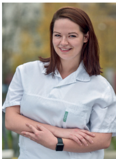
Absolventka oboru Všeobecná sestra

„Studium mne naučilo vážit si své práce, která rozhodně není jednoduchá. Jako sestry musíme držet pohromadě, i když budeme mít jiné názory a hodnoty. Vnímám pacienta jako středobod naší práce a dobrá komunikace s ním a také s kolegy je jedním ze základních pilířů našeho povolání. Chtěla bych se stále učit a posouvat vpřed, abych dělala své profesi dobré jméno. Na toto všechno mne studium na 3. LF UK připravilo!“